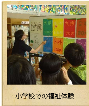
小学校での福祉体験