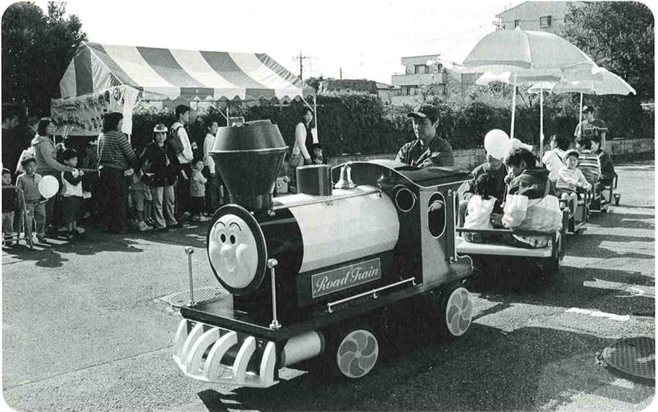
市民福祉まつり第22回ふれあい広場で大人気のロードトレイン