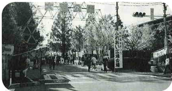
多くの方にご来場いただきました

また「ボランティアのつどい」では、昨年度に引き続き、春日部市ボランティア活動推進連絡会との共催により、車椅子バスケットボール競技体験をはじめボランティアグループの活動発表など、日頃活動されているボランティアとの交流を通して、活動の輪を広げることを目的とした様々なイベントを開催しました。