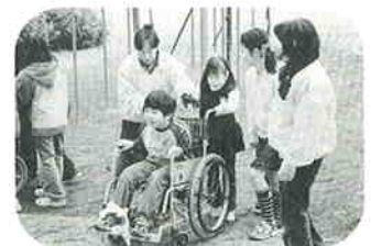
車椅子体験学習の様子

オープン3周年 イベント盛りだくさん 3/23(日)【太陽光発電システム竣工式・ミニ商工祭り・マグネット吹き矢大会・その他】