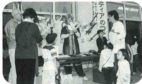
アートバルーンは大人気!! (ボランティアのつどい)