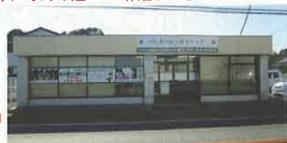
春日部・白岡家族葬ホール

春日部・白岡営業所：白岡市太田新井568-4 0480-31-6975 本社：越谷市増林5918-1 代表 048-960-7370