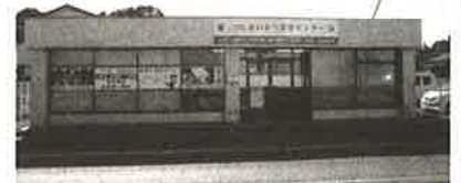
春日部・白岡家族葬ホール

春日部・白岡営業所 : 白岡市太田新井568-4 0480-31-6975 本社 : 越谷市増林5918-1 代表 048-960-7370