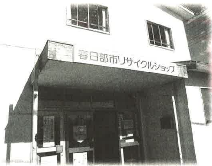
リサイクルショップリニューアルオープン