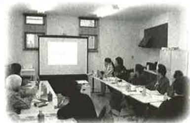
認知症について学びませんか？ ①認知症サポーター養成講座