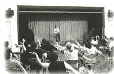
楽しく運動！介護予防！！ ②そらまめジム