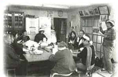
サロンなどを支援しています。 ⑤地域活動支援