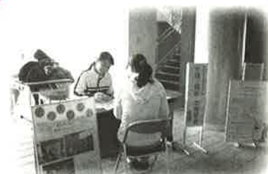
自宅近くで身近に相談！ ④出張相談会