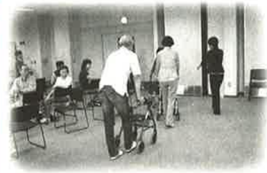
この日は福祉用具の事を学びました。 ③すまいるケア教室