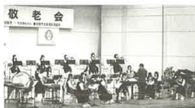
東中学校吹奏楽部