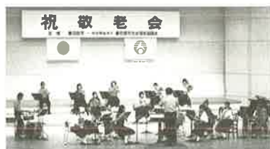
飯沼中学校吹奏楽部