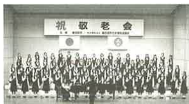
春日部中学校合唱部