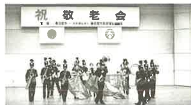
豊野中学校吹奏楽部

昨年より、アトラクション内容を一部変更しました。昨年、敬老会にお越しいただいた方々にアンケートを実施したところ、約8割強の方から「とても良かった」「中学生の合唱・演奏に感動した!」という意見が寄せられました。皆様のご来場を心よりお待ちしております。