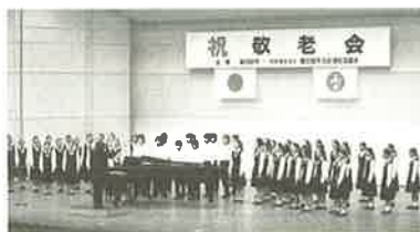
武里中学校合唱団