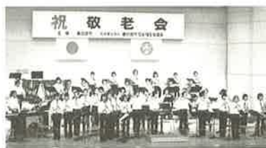
大沼中学校ウインドオーケストラ