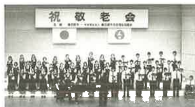
豊春中学校合唱部