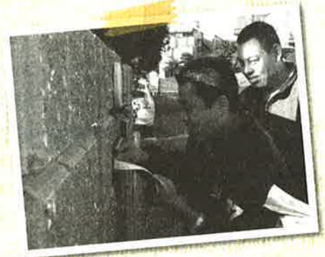
チラシ配りにまわりました