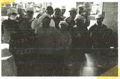
センターの明るい仲間たち