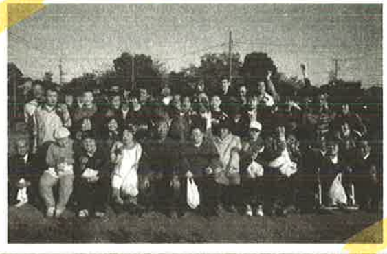
はじめてのみかん祭り

平成23年4月から市の指定管理を受け、 ふじ支援センターとゆりのき支援センターを社協で運営しています。