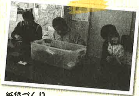
紙袋づくり 難しくてもがんばります