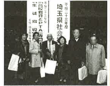
写真は埼玉県社会福祉大会にて表彰された方々(一部)です。