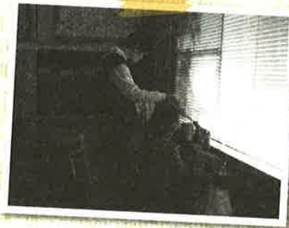
工具を使つての穴あけ