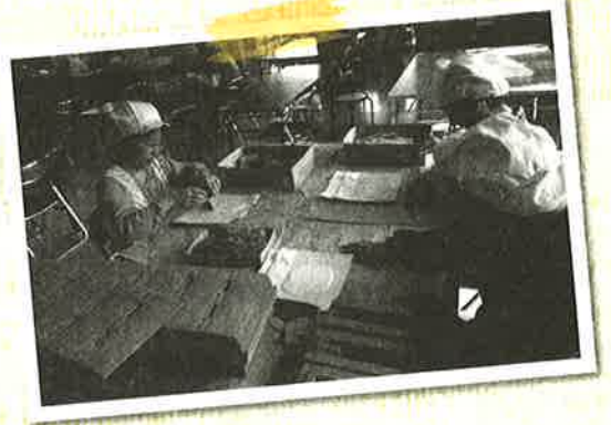
ダンボール折り 今ではみんなきれいにできます