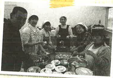
お母さんもボランティア