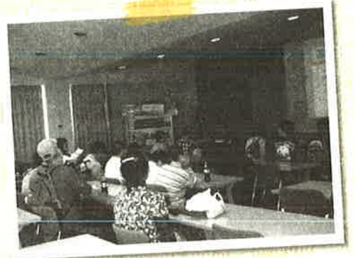
勉強もかせません