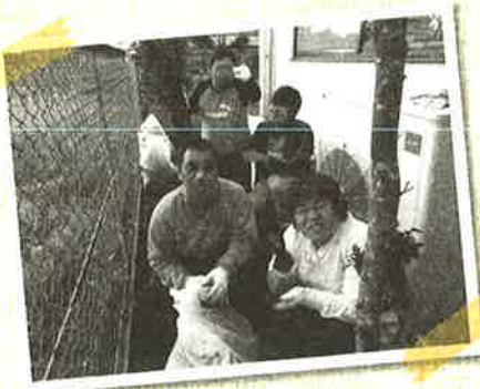
そうじや草むしりもします