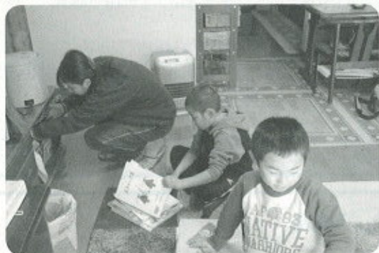
今日の宿題は…読書！

【活動の様子】 学校の放課後、お母さんが帰るまで提供会員宅で過ごしている1年生の男の子。提供会員宅の子ども（小2）とも仲良しです。