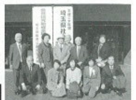
※写真は社協推薦の表彰された方々です