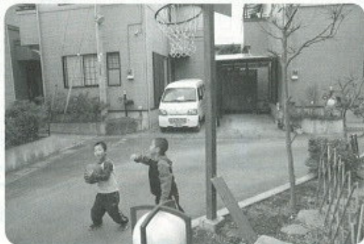
二人ともバスケットが大好き！